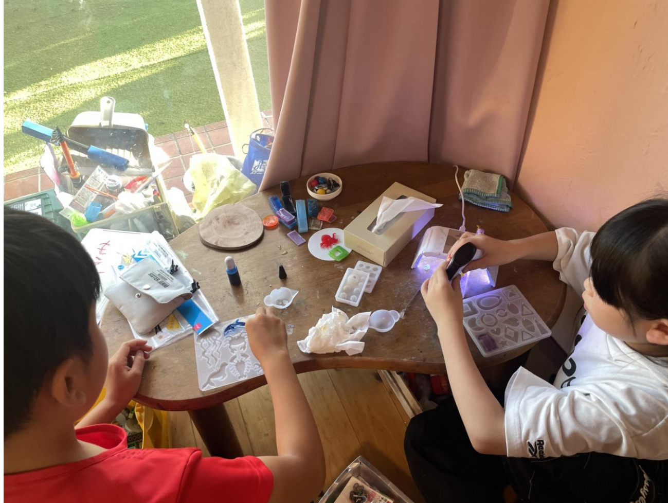
レジン飾り作りに夢中